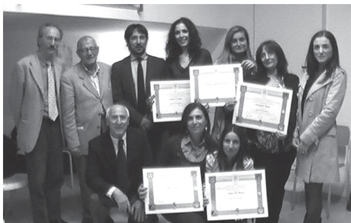
Napoli, 3 novembre 2011, consegna attestati