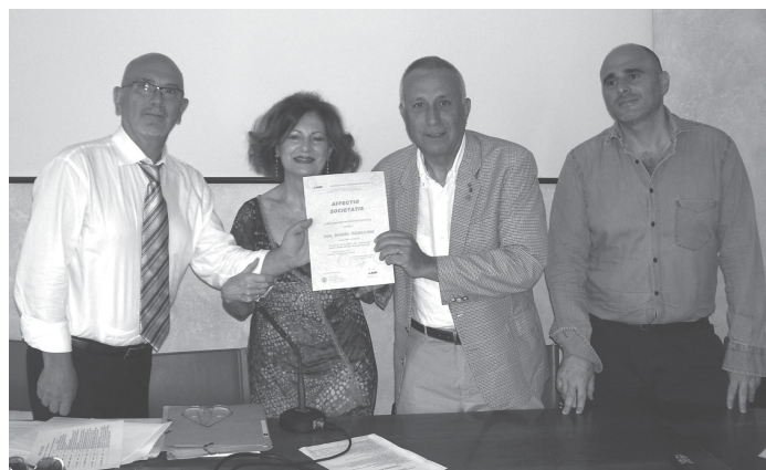
Foto di gruppo dal convegno nazionale del giugno 2011 a Roma