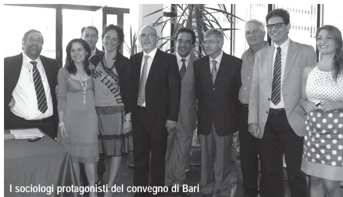
I sociologi protagonisti del convegno di Bari

Segretario regionale e dirigente nazionale Ans del Collegio dei Provvisori