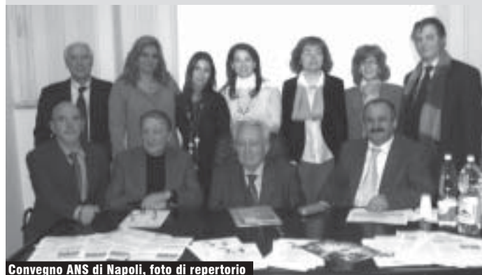
Convegno ANS di Napoli, foto di repertorio