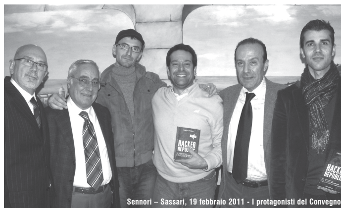
Sennori - Sassari, 19 febbraio 2011 - I protagonisti del Convegno

Sabato, 19 Febbraio 2011, presso il CENTRO CULTURALE VIA FARINA a Sennori - Sassari, si è svolto l'importante convegno che ha costituito la fase iniziale di un percorso formativo specialistico inerente alla prevenzione del crimine informatico, attraversando le mille tematiche legali, psicologiche, sociologiche ed educative fino ad arrivare alla conoscenza e alla prevenzione del rischio e all'applicazione di validi sistemi di difesa personale.