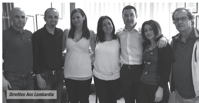
Direttivo ANS Lombardia