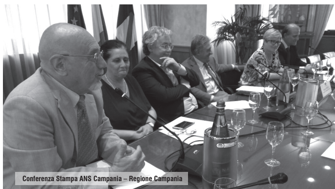
Conferenza Stampa ANS Campania - Regione Campania