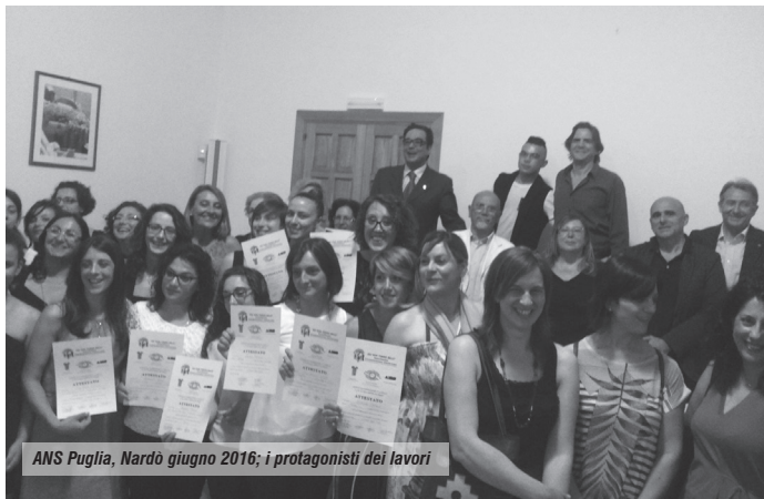
ANS Puglia, Nardò giugno 2016; i protagonisti dei lavori