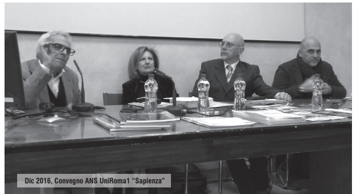
Dic 2016, Convegno ANS UniRoma1 "Sapienza"

L'ANS Nazionale, in collaborazione con la Facoltà di Scienze Politiche, Sociologia e Comunicazione, Uni Roma 1 Sapienza, e con il Dipartimento Lazio ANS, effettuerà a Roma, il 12 giugno 2017, ore 10.30 – 17.00, in Via Salaria 113, presso la Facoltà di Scienze Politiche, Sociologia e Comunicazione, Aula Wolf, il